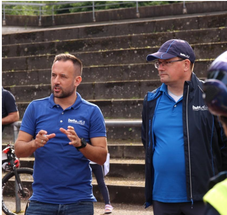
Einsatzbesprechung Kampfrichter Waiblingen 2024.

Wir wünschen allen Athletinnen und Athleten einen fairen und unfallfreien Wettkampf!