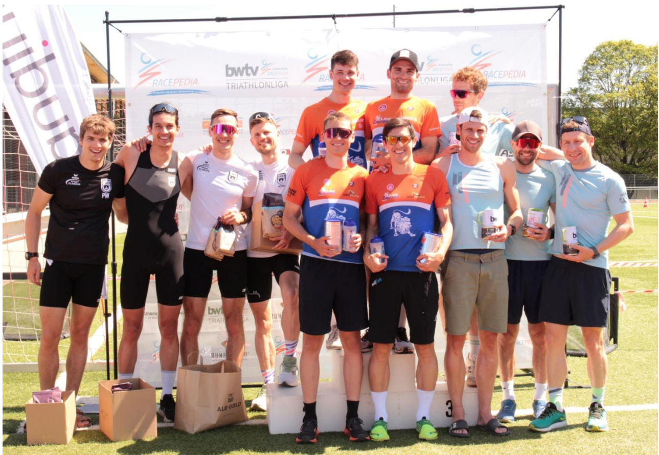
Siegerehrung 2. Liga Echterdingen 2025.

Die Siegerehrung ist Teil des Wettkampfs. Geld- und Sachpreise werden daher nur an die Athleten ausgegeben, die auch tatsächlich anwesend sind.