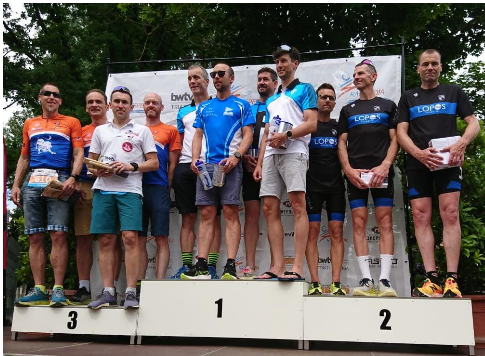
Siegerehrung Mastersliga Waiblingen 2024.