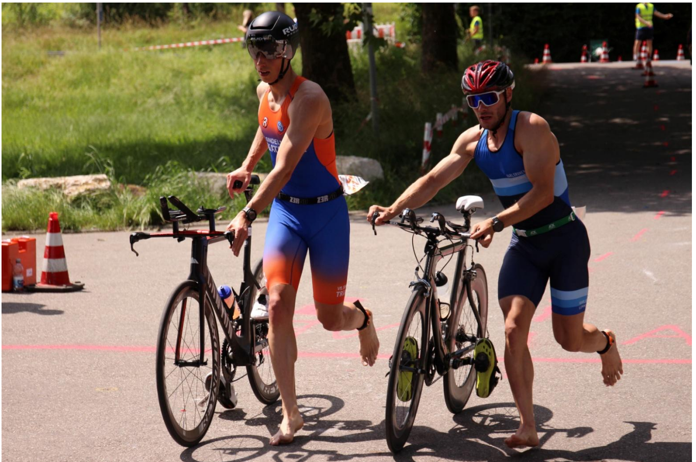
Radabstieg BWTV Triathlonliga powered by RACEPEDIA Waiblingen 2024.