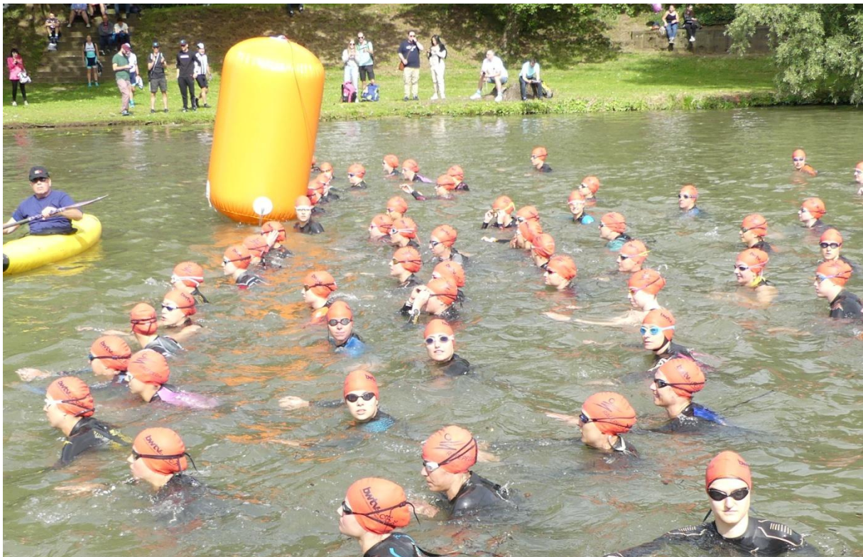
Anspannung vor dem Schwimmstart der Frauenliga in Heilbronn 2024.