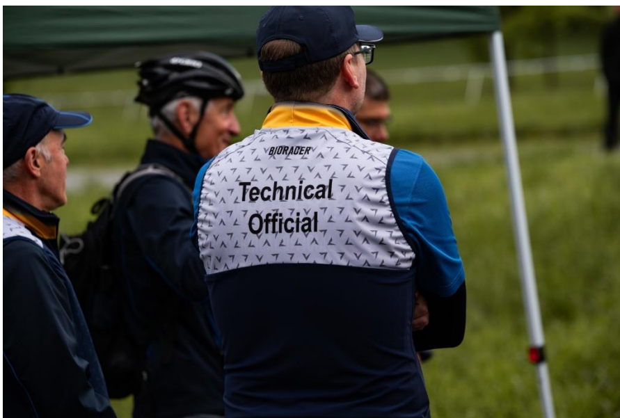
Die Kampfrichter sind ein wesentlicher Teil jeder Wettkampfveranstaltung.