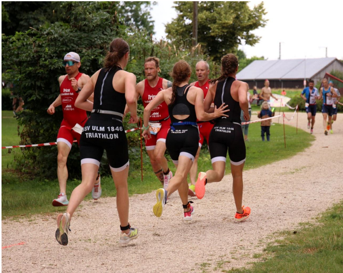
In Erbach kommt es wieder auf echten Teamspirit an.