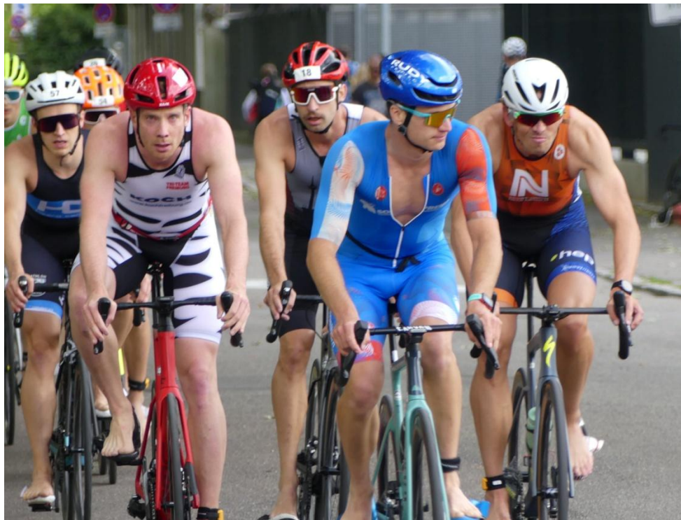
Kurz vor dem Radabstieg Heilbronn 2024.