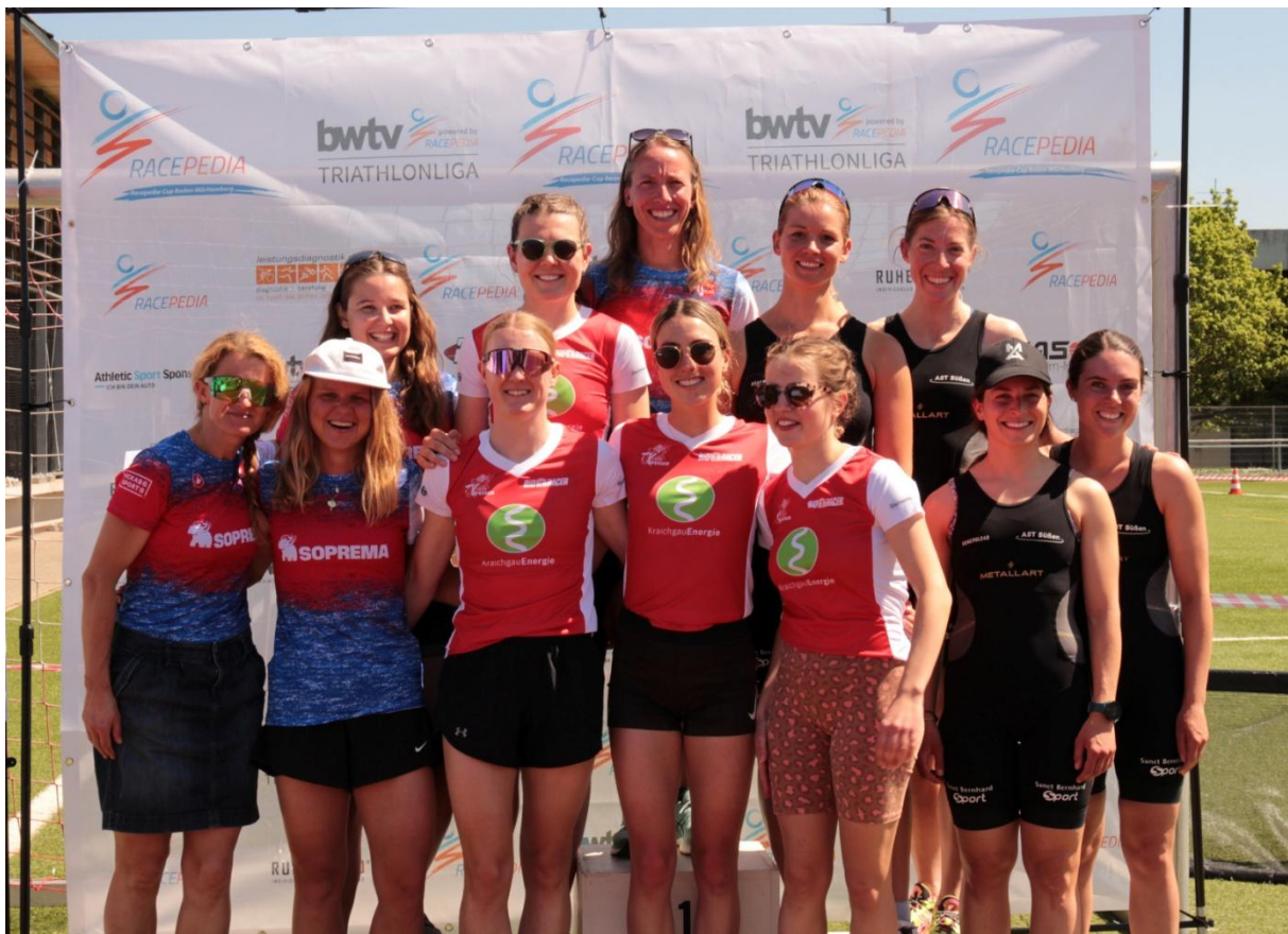
Siegerehrung Frauenliga Echterdingen 2025.

Die Siegerehrung ist Teil des Wettkampfs. Geld- und Sachpreise werden daher nur an die Athleten ausgeben, die auch tatsächlich anwesend sind.