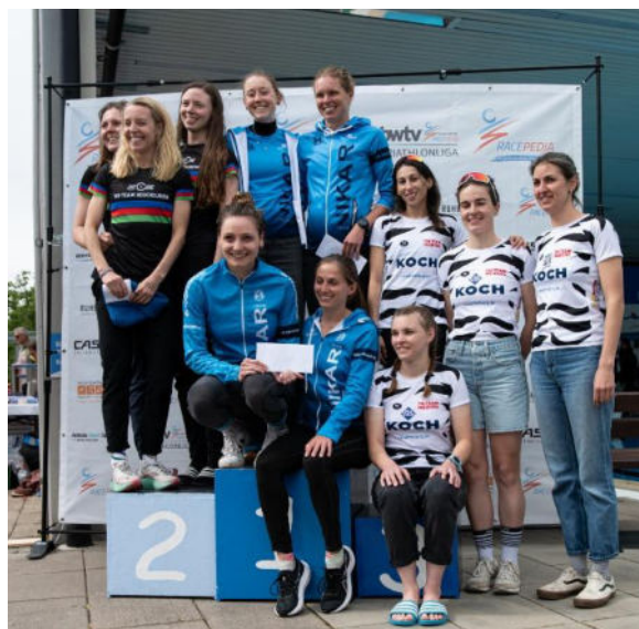
Siegerehrung Frauenliga Karlsruhe 2024.