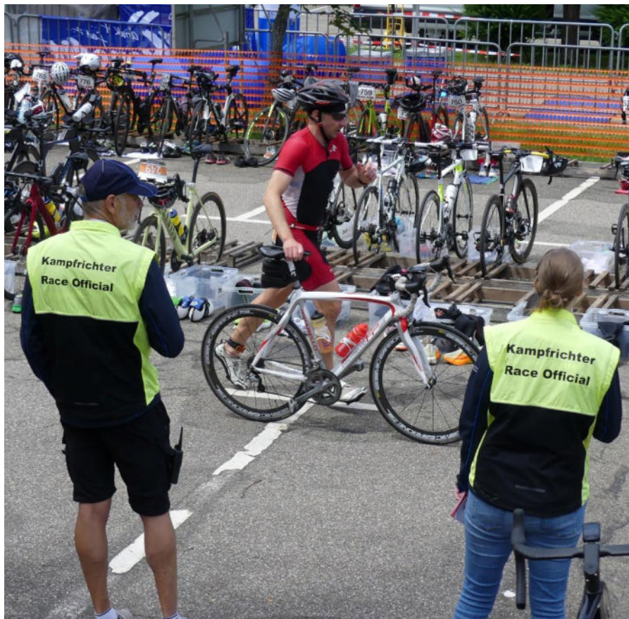
Auch 2025 werden die Kampfrichter ein wache Auge auf faire Wettkampfabläufe haben.

Wir wünschen allen Athletinnen und Athleten einen fairen und unfallfreien Wettkampf!