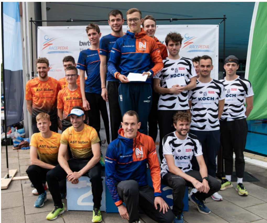
Siegerehrung 1. Liga Karlsruhe 2024.

Die Siegerehrung ist Teil des Wettkampfs. Geld- und Sachpreise werden daher nur an die Athleten ausgegeben, die auch tatsächlich anwesend sind.