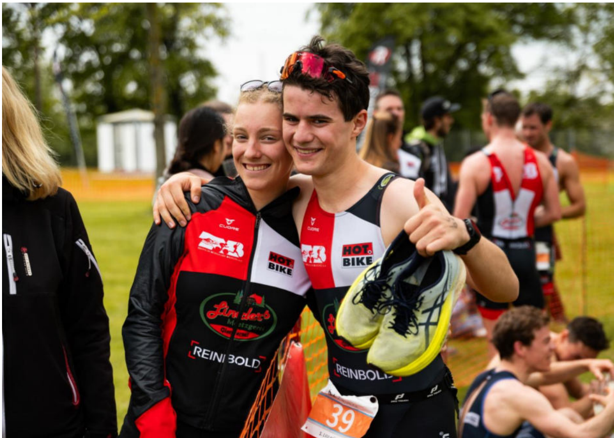
Geteilte Freude ist doppelte Freude - nach dem Zieleinlauf Karlsruhe 2024