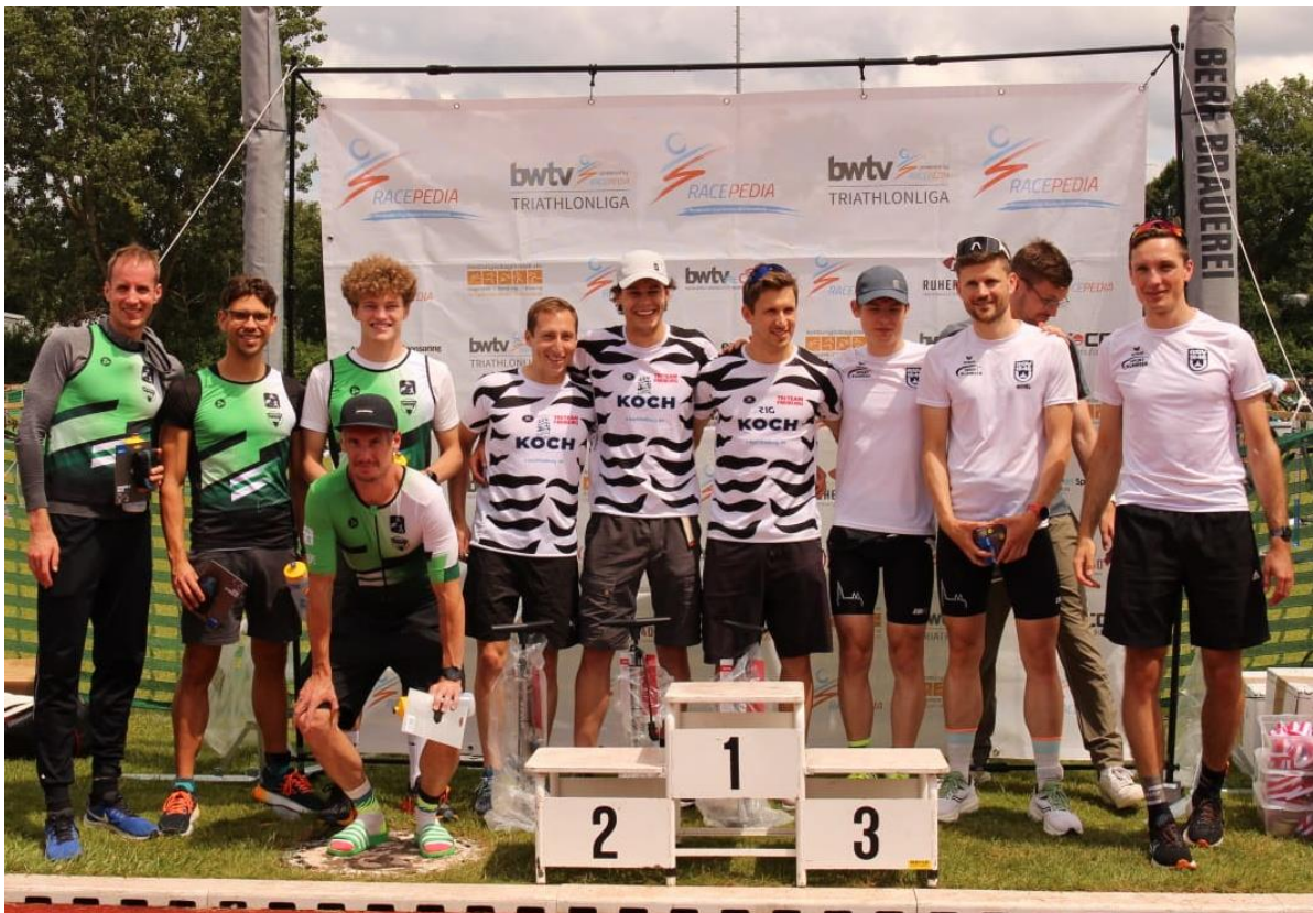
Siegerehrung Landesliga Süd in Erbach (von links): VfL Herrenberg, OBERLE Tri-Team Freiburg 2, Gold Ochsen Team SSV Ulm 1846

Die Siegerehrung ist Teil des Wettkampfs. Geld- und Sachpreise werden daher nur an die Athleten ausgegeben, die auch tatsächlich anwesend sind.