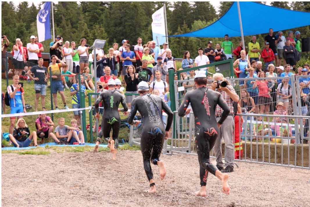
Schluchsee 2023 – Landgang zur zweiten Schwimmrunde