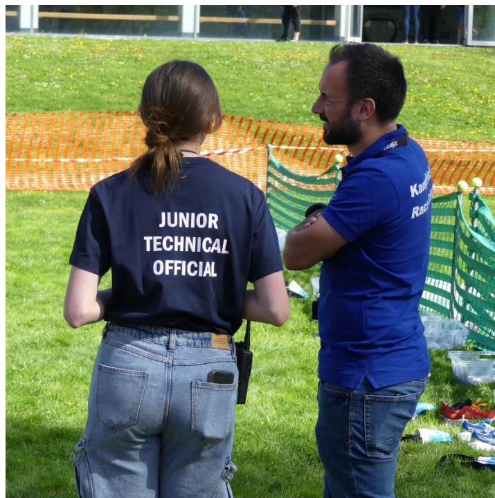
Seit 2023 werden jugendliche Nachwuchs-Kampfrichter zum „Junior-TO“ ausgebildet.

Wir wünschen allen Athletinnen und Athleten einen fairen und unfallfreien Wettkampf!