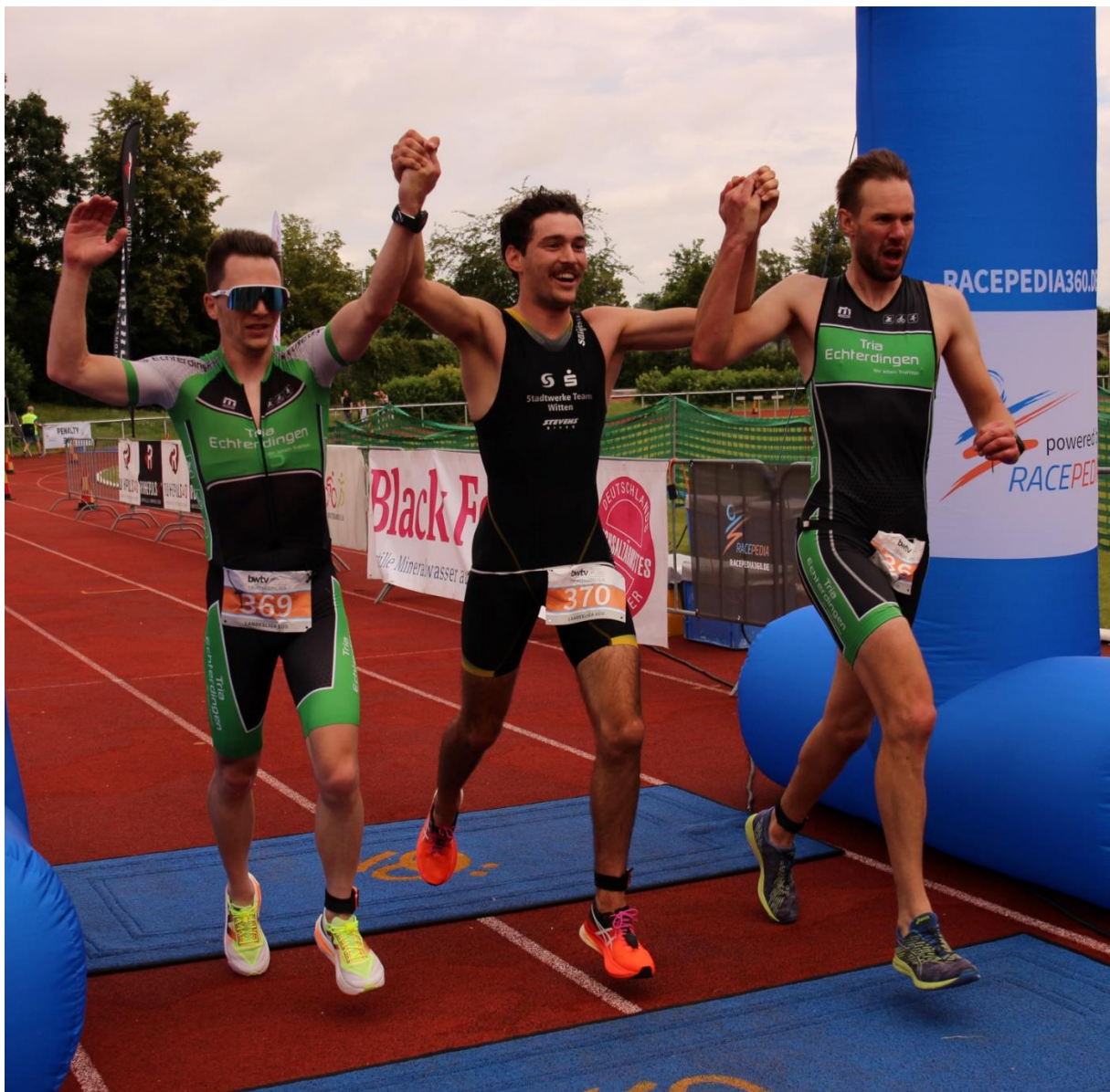
Erbach 2024 Zieleinlauf Tria Echterdingen, Landesliga Süd.