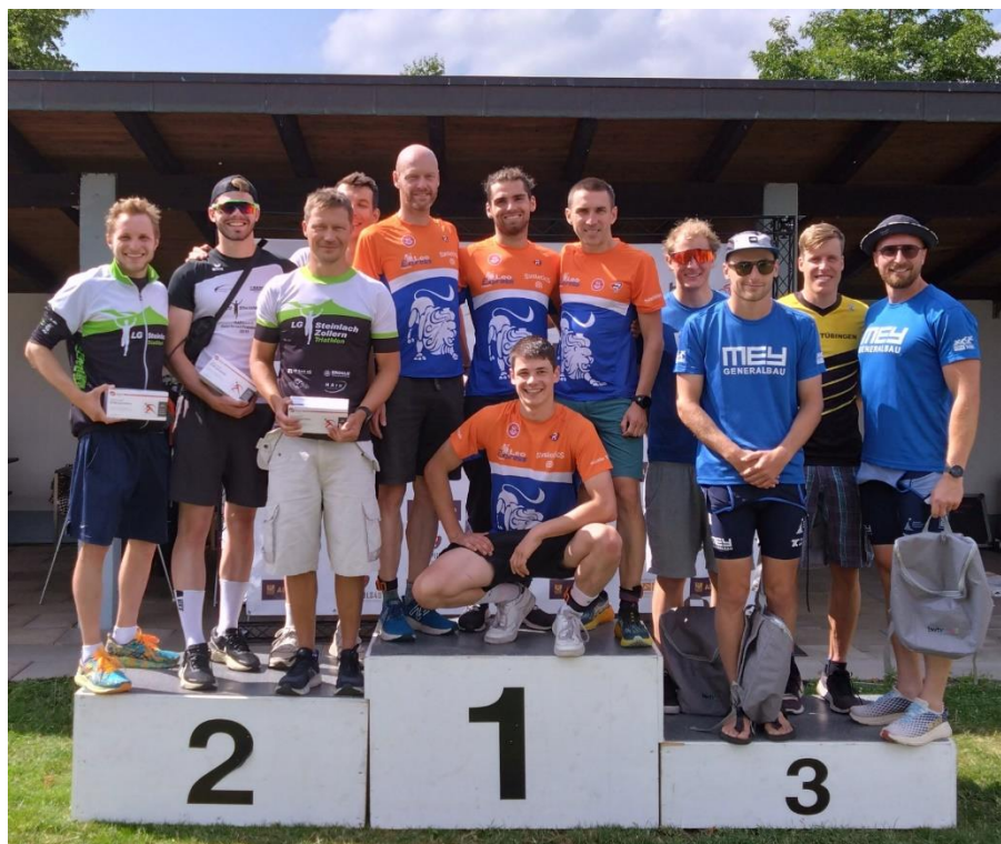
Siegerehrung Liga Schopfheim 2023:

2. LG Steinlach-Zollern, 1. Team Leo Express Logistik TSV Calw 2, 3. Mey Post-SV Tübingen.