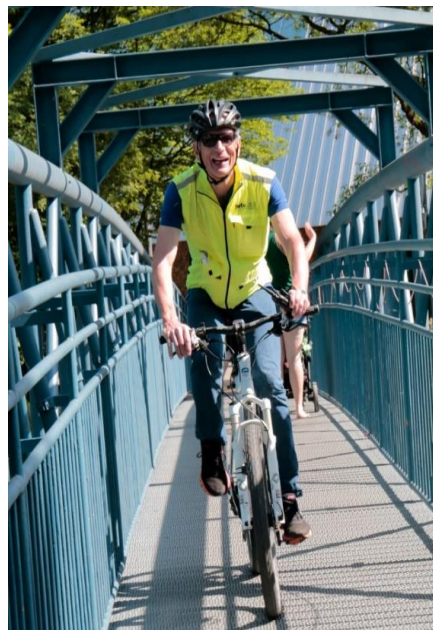
Kampfrichter im Einsatz!

Wir wünschen allen Athletinnen und Athleten einen fairen und unfallfreien Wettkampf!