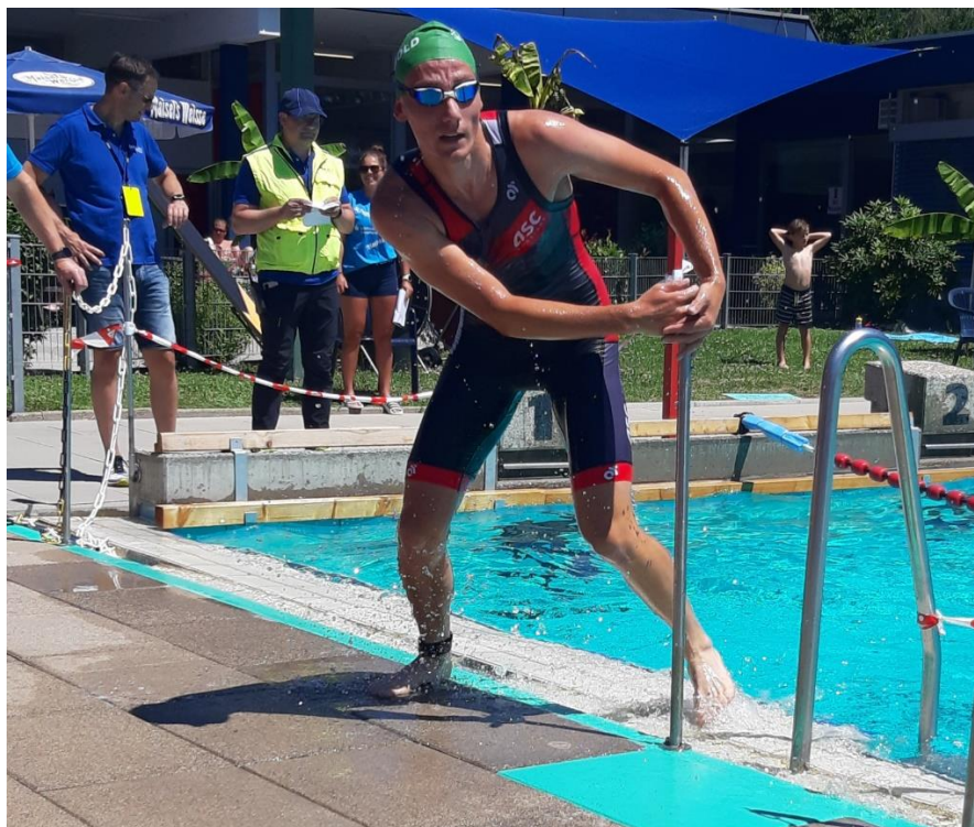
Schwimmausstieg Landesliga Süd Schopfheim 2022.