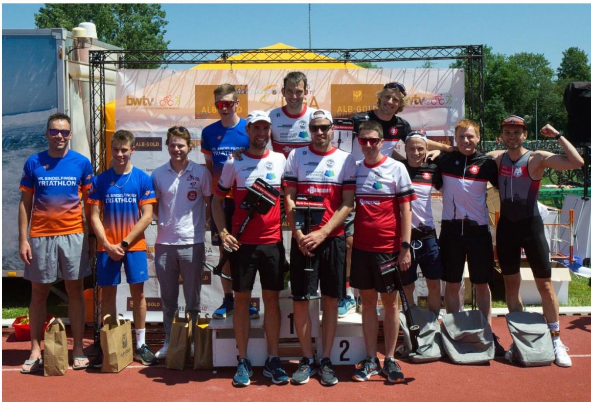
Siegerehrung Landesliga Süd in Erbach – wer steht in Schopfheim auf dem Podest?

Die Siegerehrung ist Teil des Wettkampfs. Geld- und Sachpreise werden daher nur an die Athleten ausgegeben, die auch tatsächlich anwesend sind.