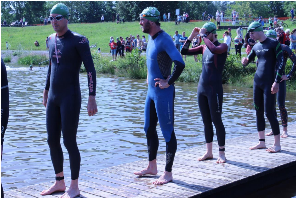
Welzheim war einer der wenigen Veranstalter, die auch 2021 einen Wettkampf organisierten. Hier die Aufstellung zum Start der Landesliga Nord – schön mit Abstand!