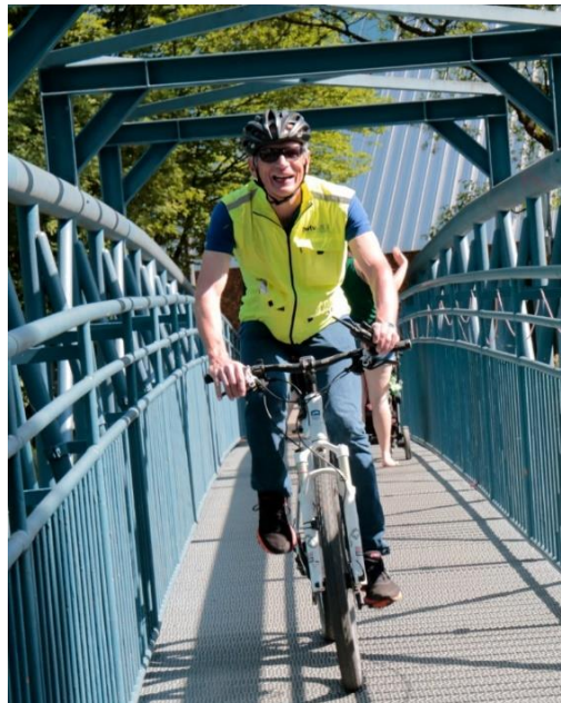
Kampfrichter im Einsatz!

Wir wünschen allen Athletinnen und Athleten einen fairen und unfallfreien Wettkampf!