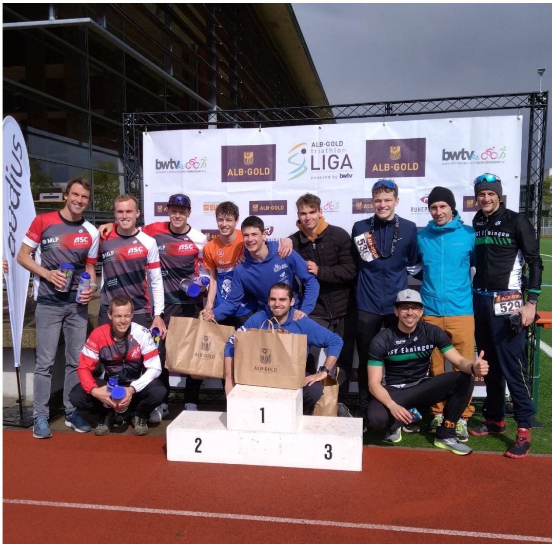
Siegerehrung Landesliga Süd in Echterdingen.