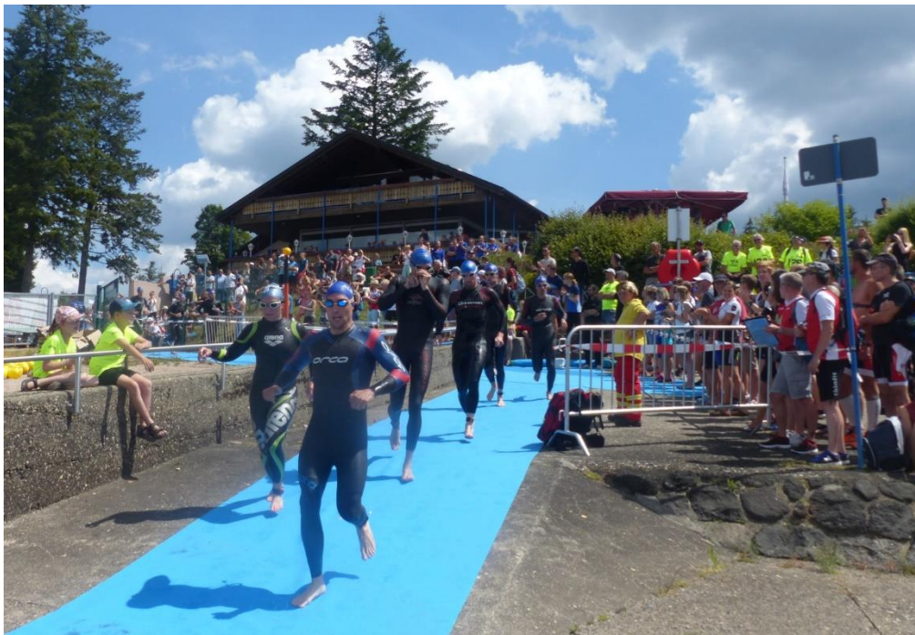
Der Schluchsee-Triathlon ist sowohl für die Athleten als auch die Zuschauer immer wieder ein großartiges Erlebnis.